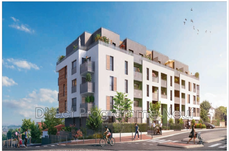
Apartment ref. 802N7868A Cachan

Programme : JARDINS DE SERENA, Promoter: EDELIS, nb. logements : 103, nb. buildings: 5, zone cadastrale : AD N° 137, 143, 166, 356, Building quality: RT 2012, Taxation: Pinel, Type de résidence : Résidence principale ou investissement, Estimated delivery date: 2ND QUARTER 2023, Prix Min. : 455000.00 / Prix Max. : 509000.00