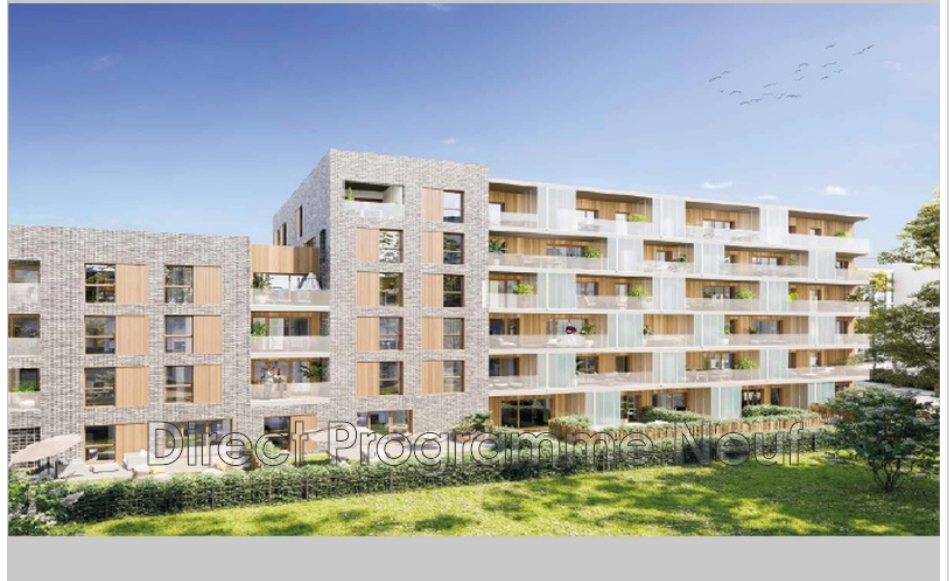
Apartment ref. 802N7927A Gennevilliers